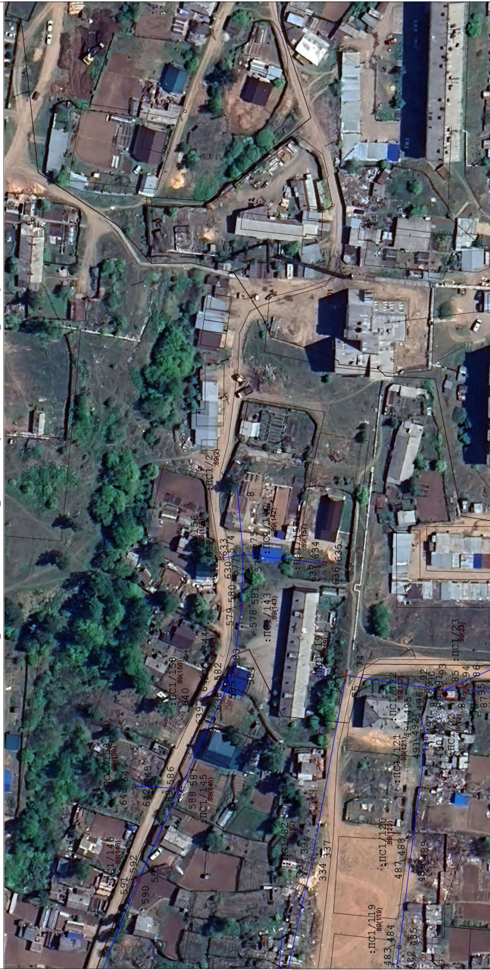
Масштаб: 1 : 1050