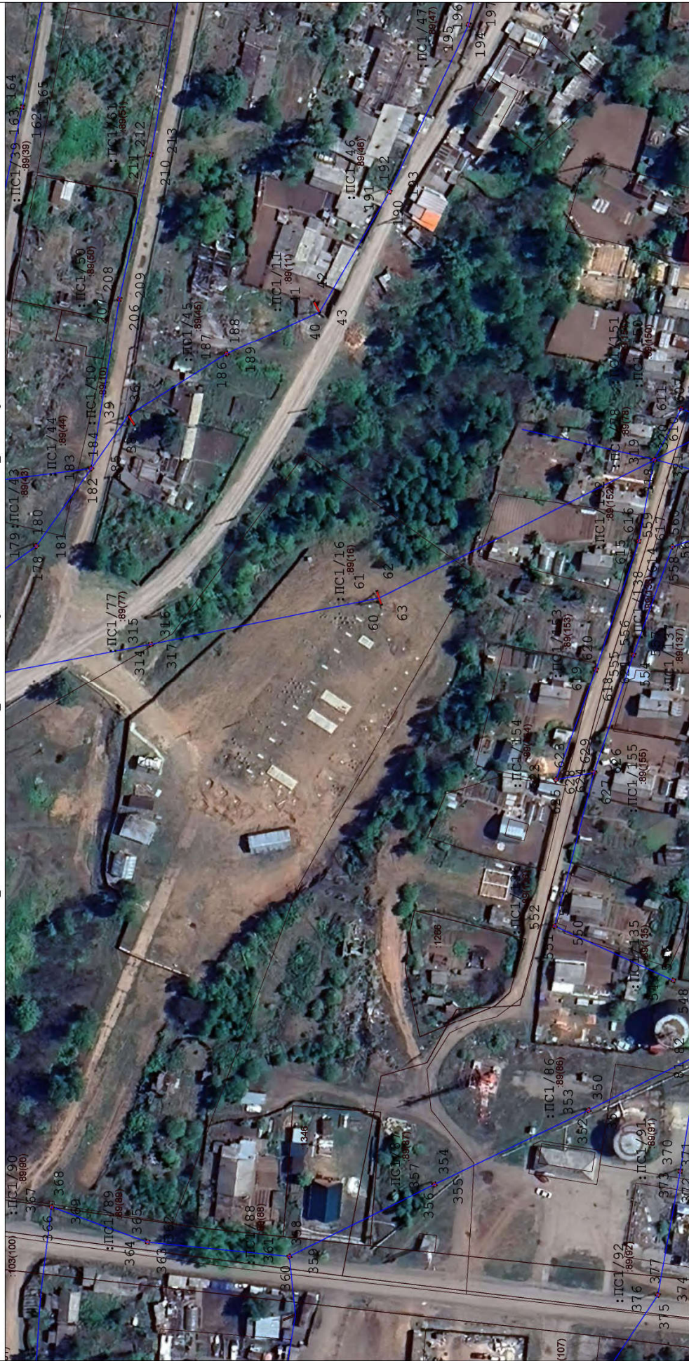
Масштаб: 1 : 1050