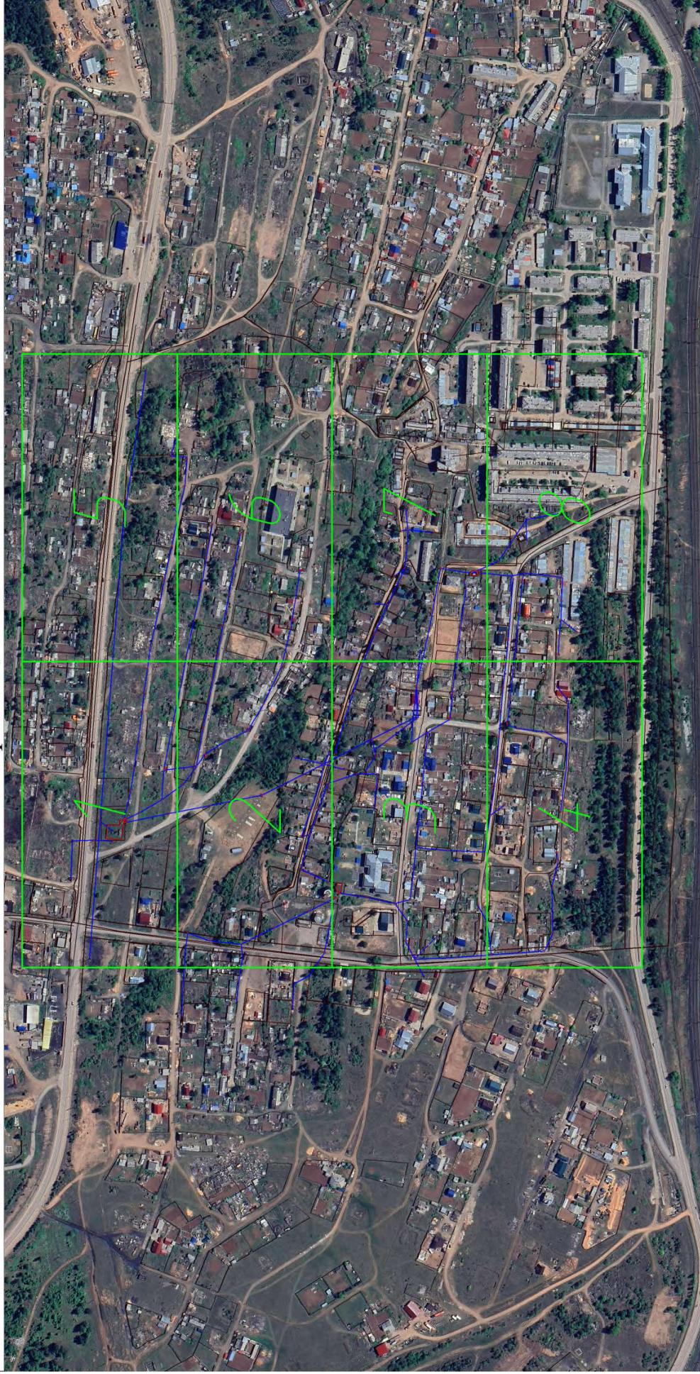
Схема расположения границ публичного сервитута Схема размещения листов