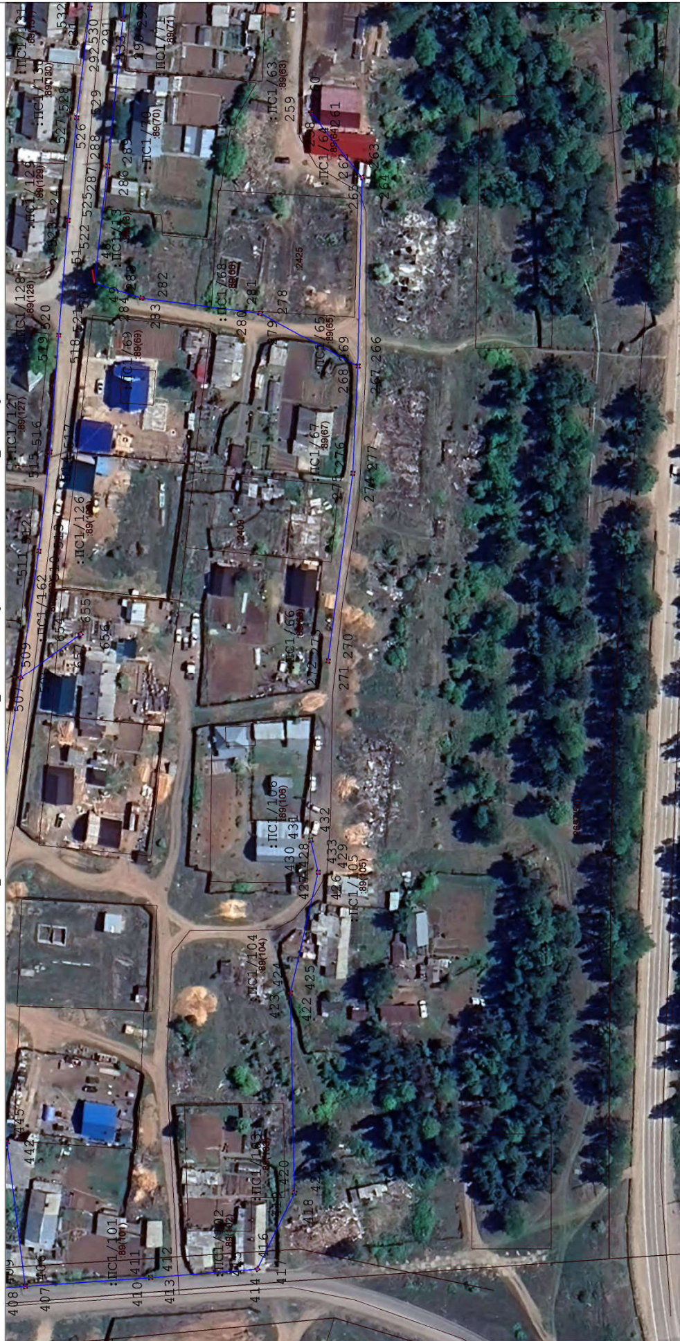
Масштаб: 1 : 1050