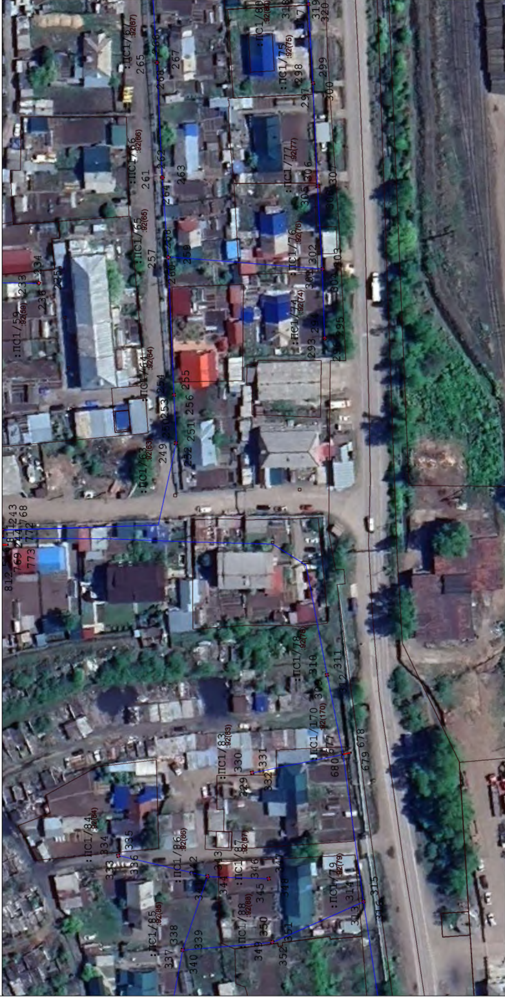
Масштаб: 1 : 1000