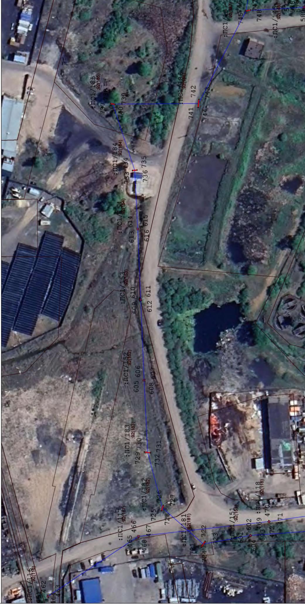
Схема расположения границ публичного сервитута