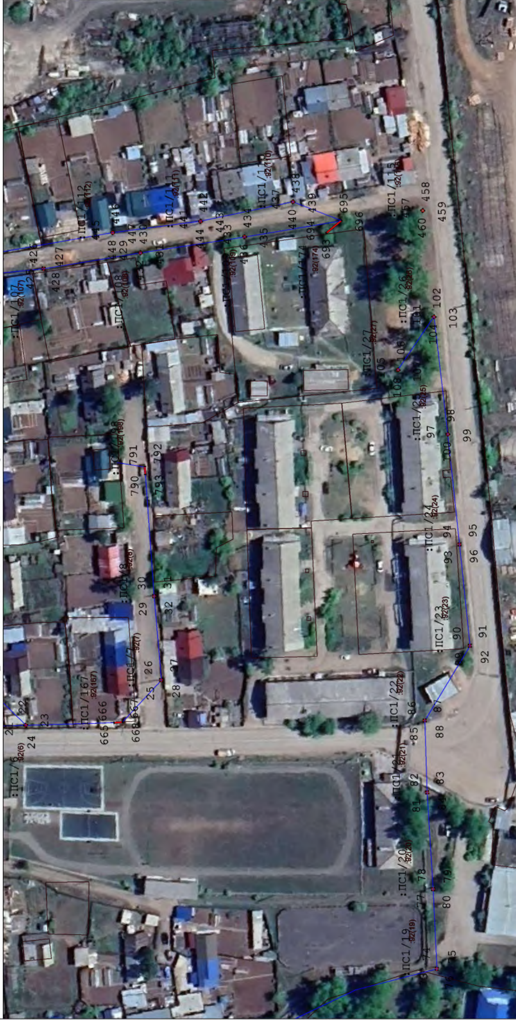
Схема расположения границ публичного сервитута