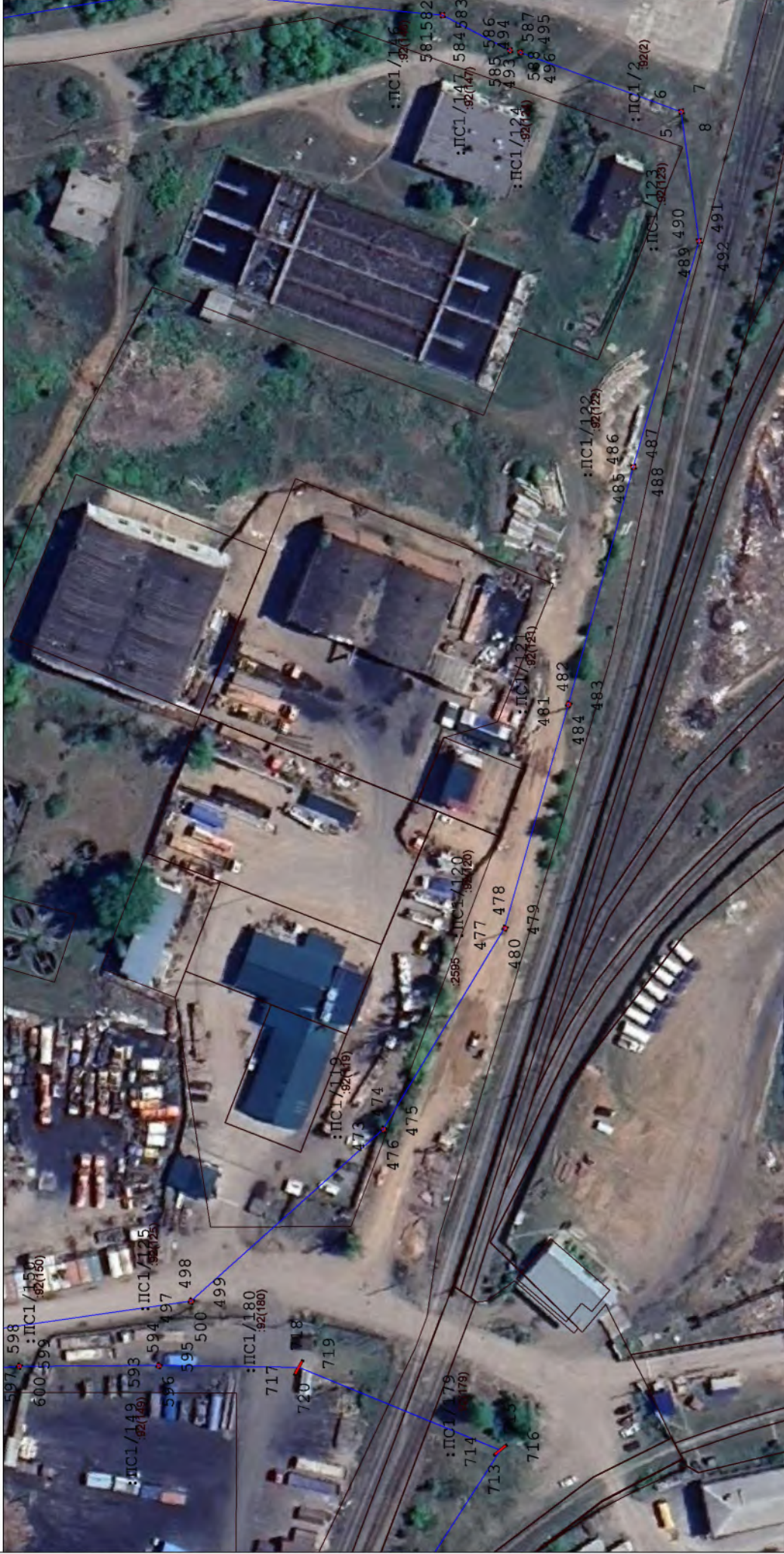
Схема расположения границ публичного сервитута